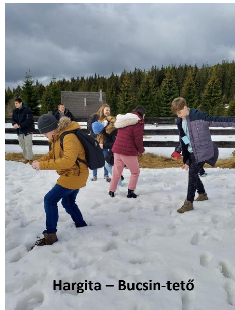
Hargita – Bucsin-tető

Az időjárás előrejelzést figyelembe véve (erős havazás) megcseréltük a 2. és a 3. napi programot, így a fenséges Hargita meghódítása volt a cél. Szerpentes utakon haladtunk, és útközben a Bucsin-tetőn megálltunk hógolyózni. Egy „kis” hófoltot találtunk a tisztáson, de ekkora havat a gyerekek még nem láttak.